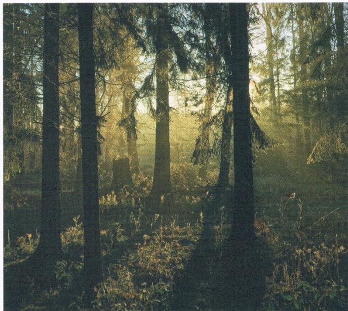
Hoe vaak VERANDER je, mooi bos, en vind daarbij altijd nieuwe wegen!